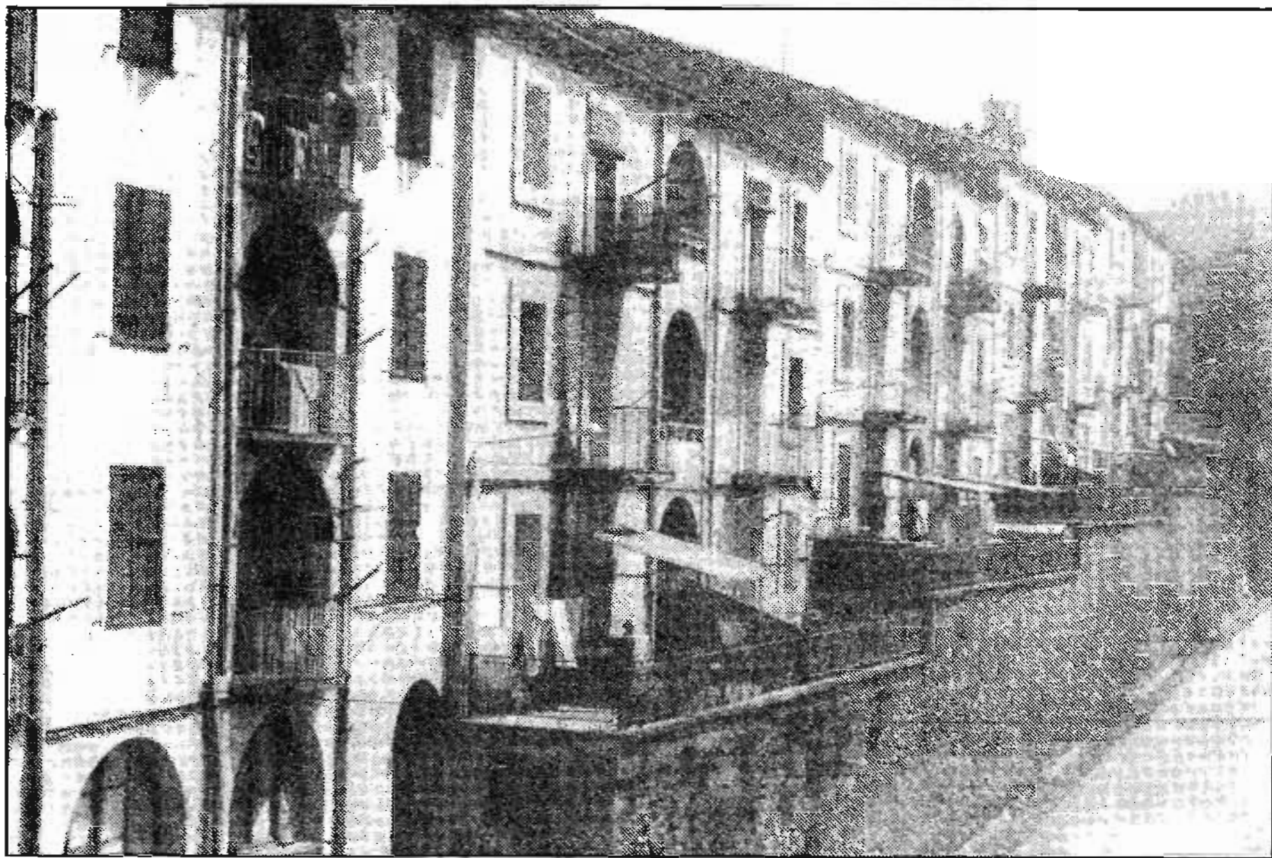
El nombre d'habitants de la colònia tèxtil de La Farga s'ha reduït amb el temps: de 1 057 persones l'any 1940 fins 300 en l'actualitat.

La població de la colònia ha comptat, des de sempre, amb una dinàmi-