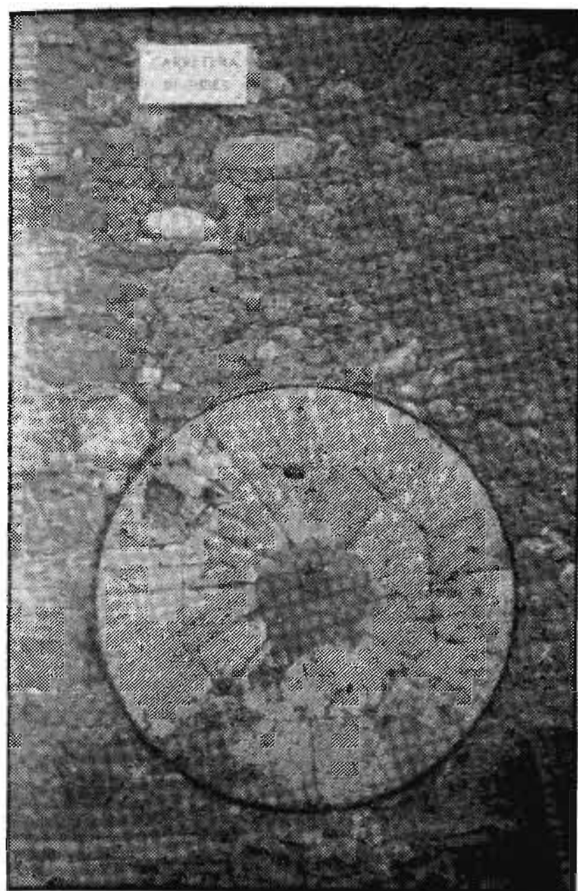
Detall d'una de les rodes de molí, autent ques, que hi ha a la façana.

1896 i, finalment, la més propera ens la dona la Gran Enciclopèdia Catalana a l'any 1900.