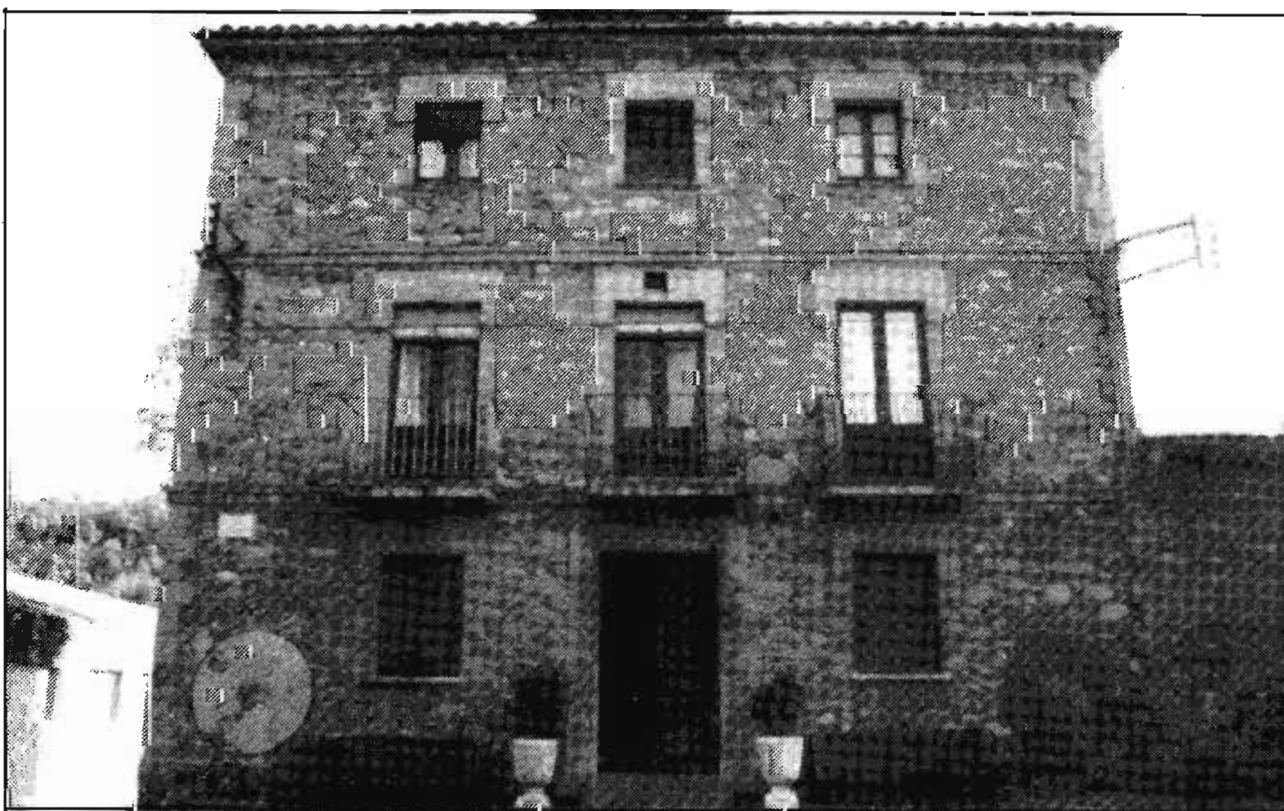
Façana de «Cal Moliner», a Montesquiu. Avui en dia encara hi viu un dels nets del moliner Joan Tubau i Vilageliu.

Es pot, però, aventurar la data de la seva fundació en el període aproximat de 1899-1900, després de la venda de l'antic molí i de l'immediata construcció de la fàbrica, ja que la primera documentació investigada —altes de maquinària— data de l'any 1900. Tampoc la consulta bibliogràfica aclareix gran cosa al respecte. La Geografia Comarcal de Catalunya data la fundació a l'any 1899, el catàleg actual de l'empresa la situa al